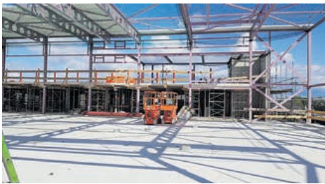
Aanleg dak van het Sporthuis