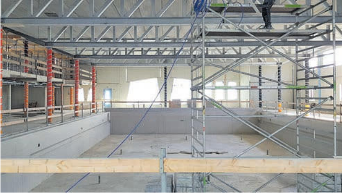
Dit wordt het zwembad